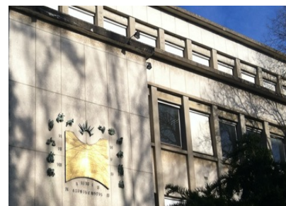
Le 503, écosystème d'innovation de l'Institut d'Optique Graduate School

Chiffre d'affaire global des entreprises FIE : 15M d'euros / an